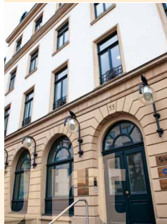
ISM Campus Frankfurt / Main